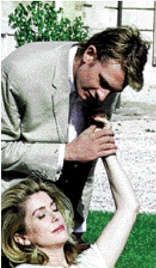
Guillaume Depardieu et Catherine Deneuve