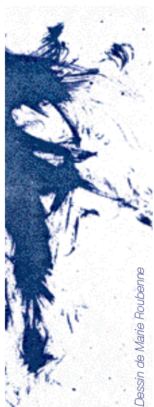
Dessin de Marie Roubenne

Comment est née l'idée d'une version télévisuelle de Pola X ?