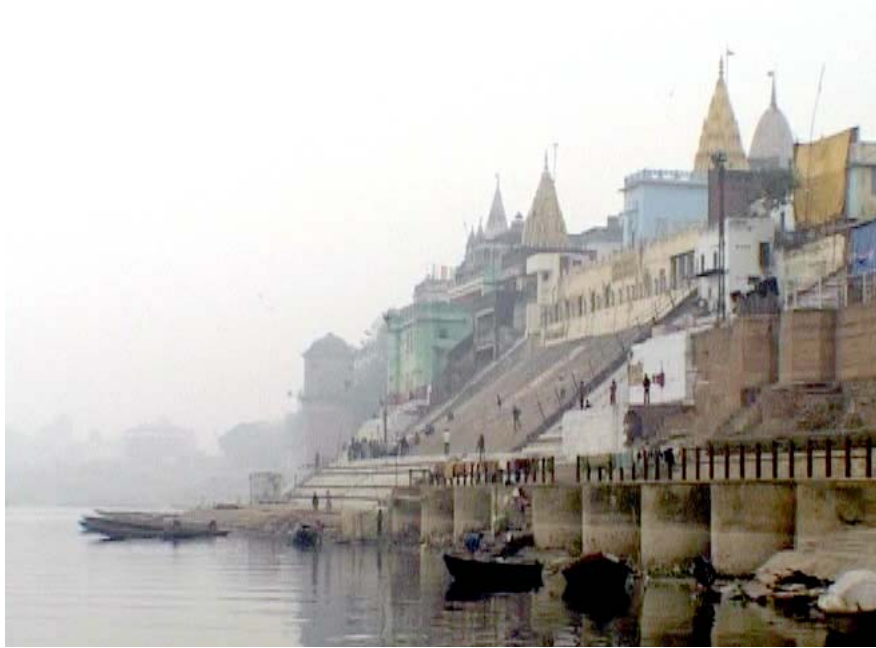
Bénarès, au bord du Gange

Coproduction : ARTE France, DOC EN STOCK