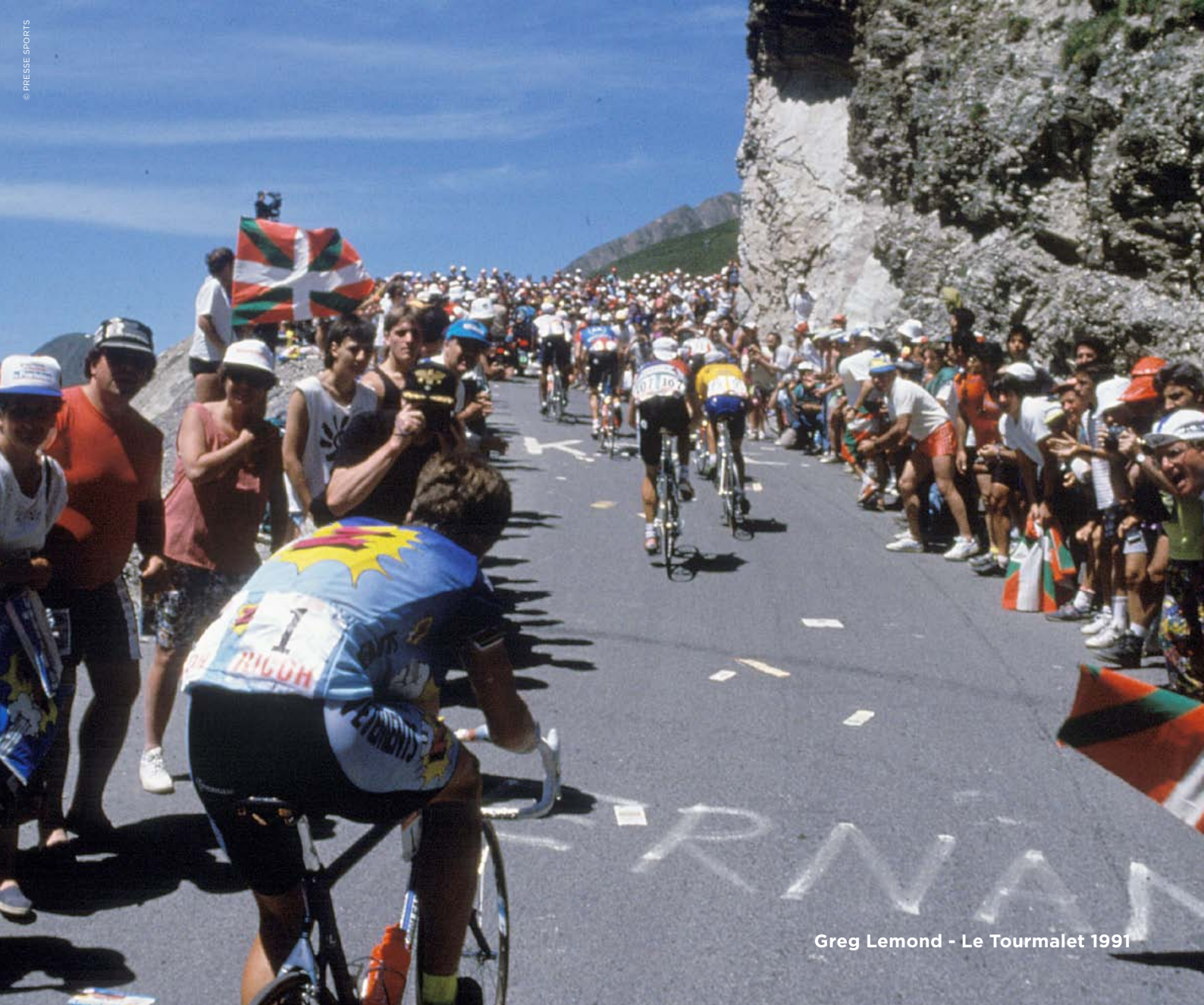
Greg Lemond - Le Tourmalet 1991

DU LUNDI 24 AU VENDREDI 28 JUIN 2013 À 17.35