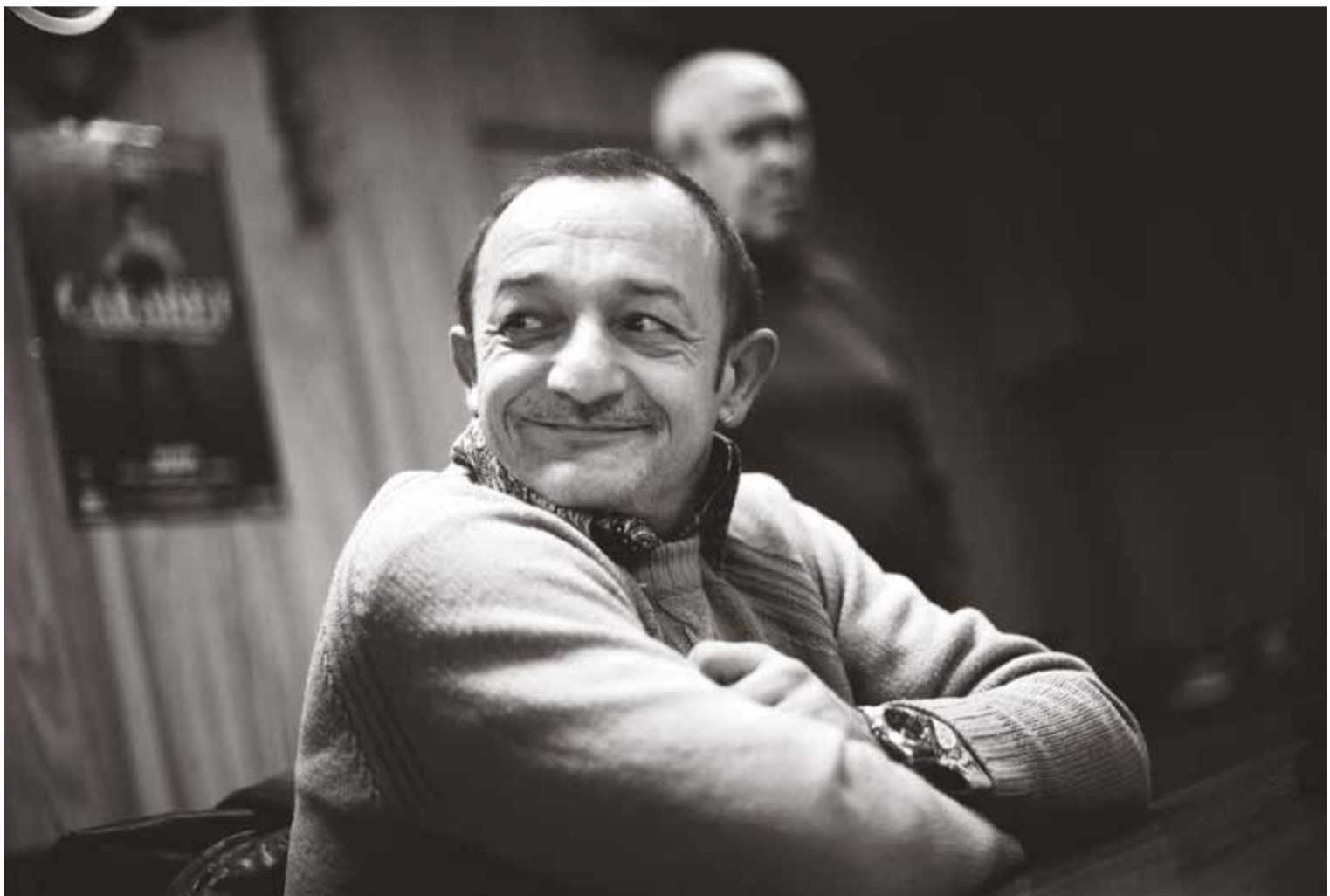
UNE CERTAINE IDÉE DE LA FRANCE © FRANCESCO ACERBIS & ARTE