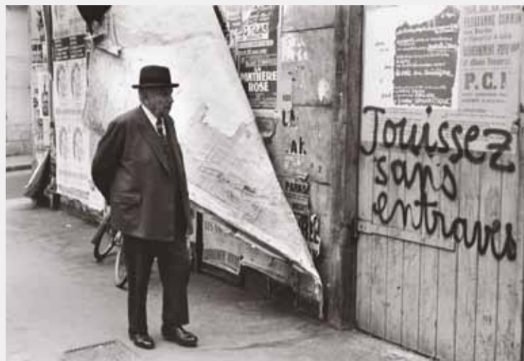
RUE DE VAUGIRARD, PARIS, MAI 1968

© HENRI CARTIER-BRESSON / MAGNUM PHOTOS, COURTESY FONDATION HCB