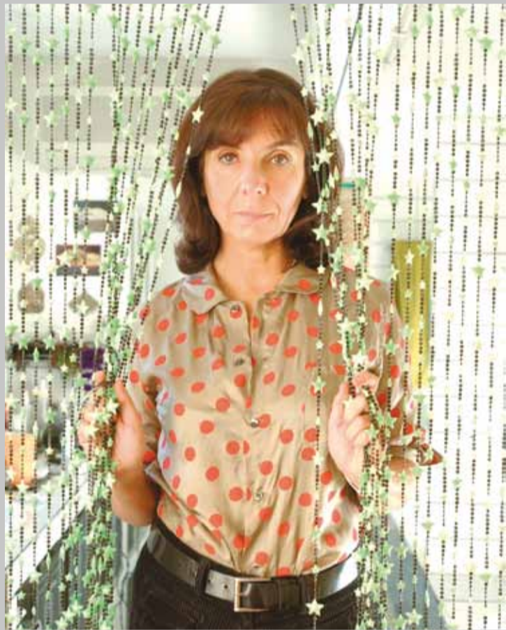
SOPHIE CALLE

A l'occasion de son exposition aux Rencontres d'Arles et de sa lecture au Cloître des Célestins en Avignon, Sophie Calle est l'invitée de Square . Elle évoquera son actualité et nous livrera son regard sur le monde.