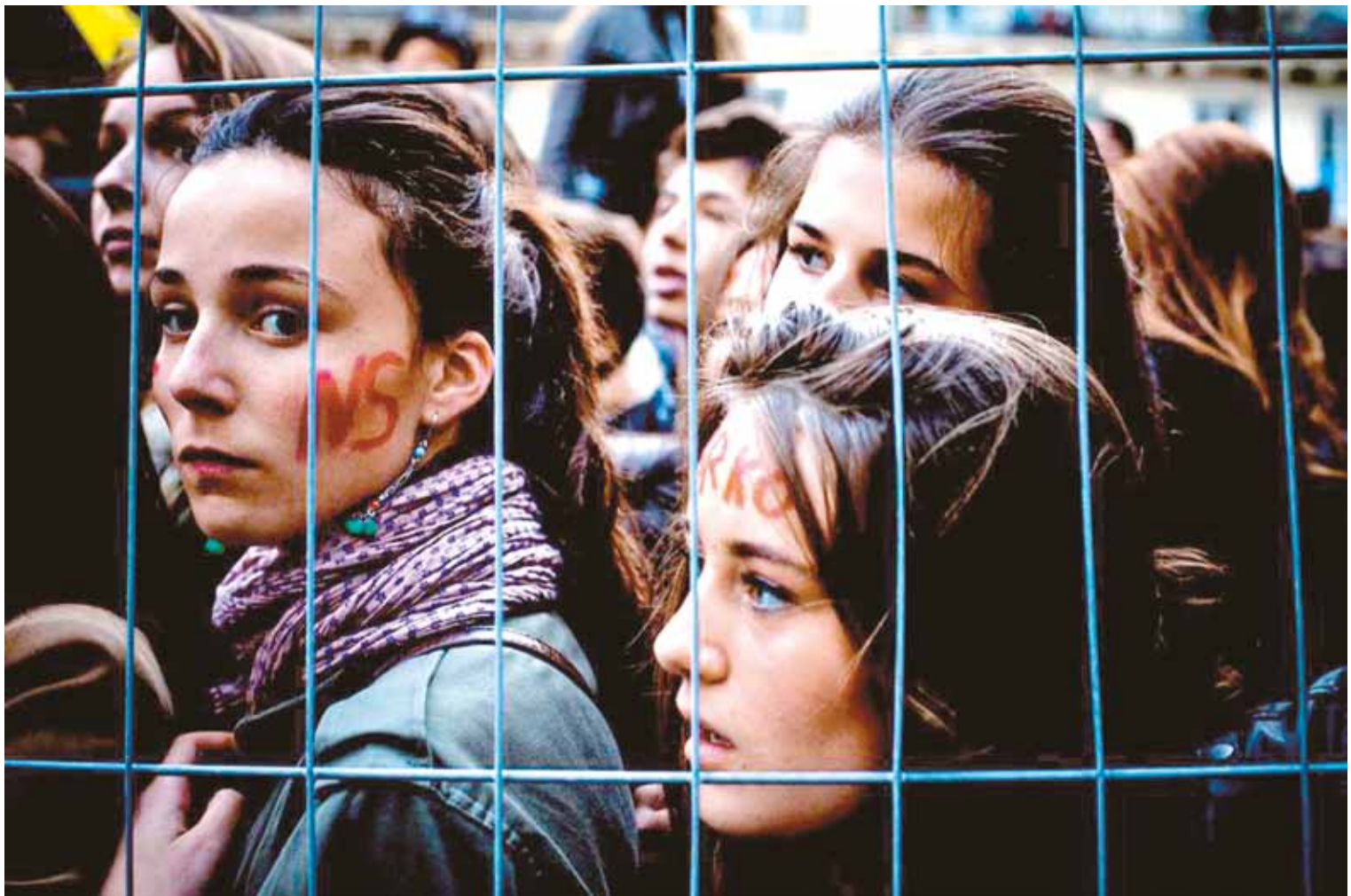
PHOTOGRAPHIE DE CAMPAGNE