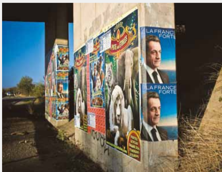
PHOTOGRAPHIE DE CAMPAGNE

Un récit quotidien de la campagne présidentielle, sous forme d'une série de 35 modules de 2 minutes, par trois jeunes photographes engagés: Gilles Coulon, Claudia Imbert et Stéphane Lavoué, conseillés par la journaliste Judith Perrignon. Un autre regard sur ce moment d'histoire de France.