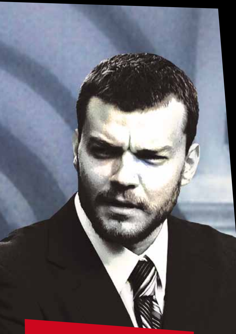
KASPER JUUL PILOU ASBÆK