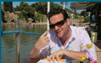
HENRY MICHEL ANIME CANNES INSIDE

Une revue commentée de tweets, d'interviews et d'extraits de films réalisée par 30 festivaliers «Insiders» - blogueurs, producteurs, journalistes, starlettes, critiques ou incrustes. Une émission quotidienne de 8 minutes produite avec Vodkaster, le réseau social du cinéma.