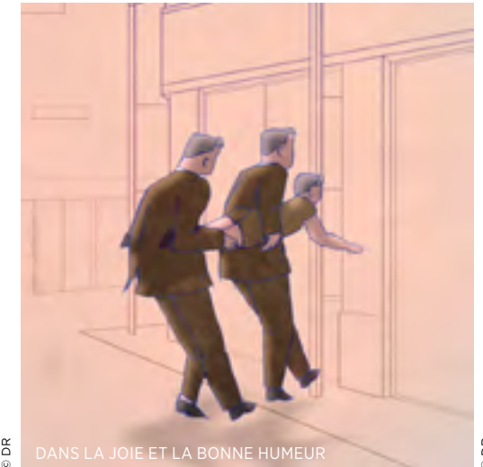
DANS LA JOIE ET LA BONNE HUMEUR