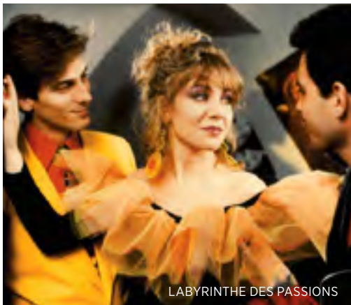
LABYRINTHE DES PASSIONS