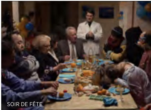
SOIR DE FÊTE