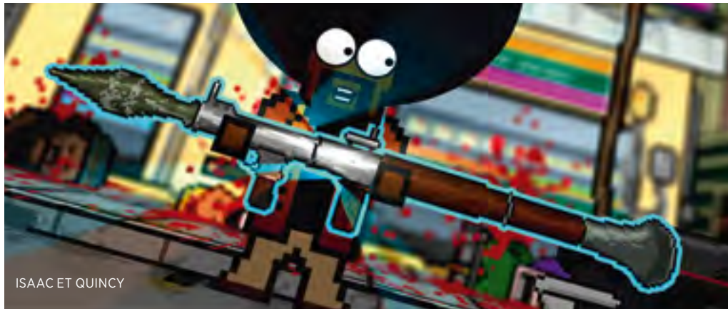
ISAAC ET QUINCY

Les collectifs de réalisateurs SchnelleBunteBilder et KlingKlangKlong ont recours à Kinect , interface entre l'ordinateur et l'homme, dans leur installation audiovisuelle Momentum. Le film de trois minutes qu'ils en ont tiré a même obtenu le statut « Staff Pick » sur la plate-forme Vimeo.29