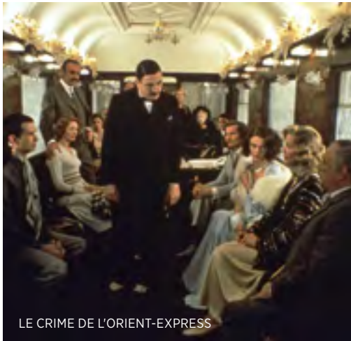
LE CRIME DE L'ORIENT-EXPRESS