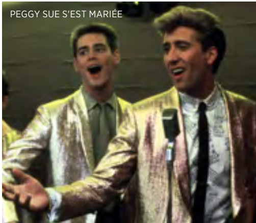
PEGGY SUE S'EST MARIÉE