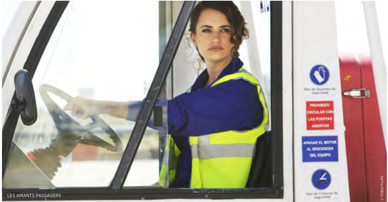
LES AMANTS PASSAGERS