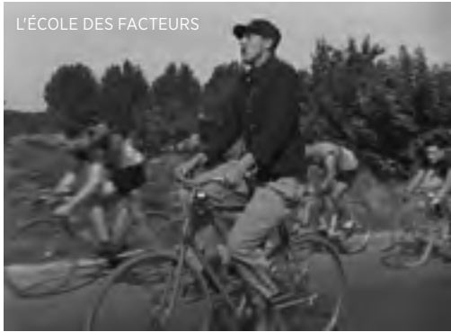
L'ÉCOLE DES FACTEURS