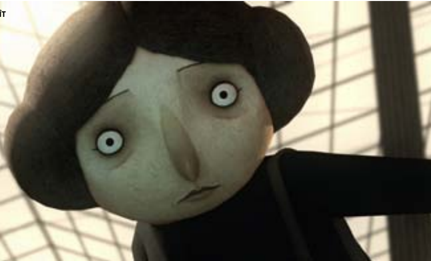
UNE TÊTE DISPARAÎT

SPÉCIAL FESTIVAL DU FILM D'ANIMATION D'ANNECY