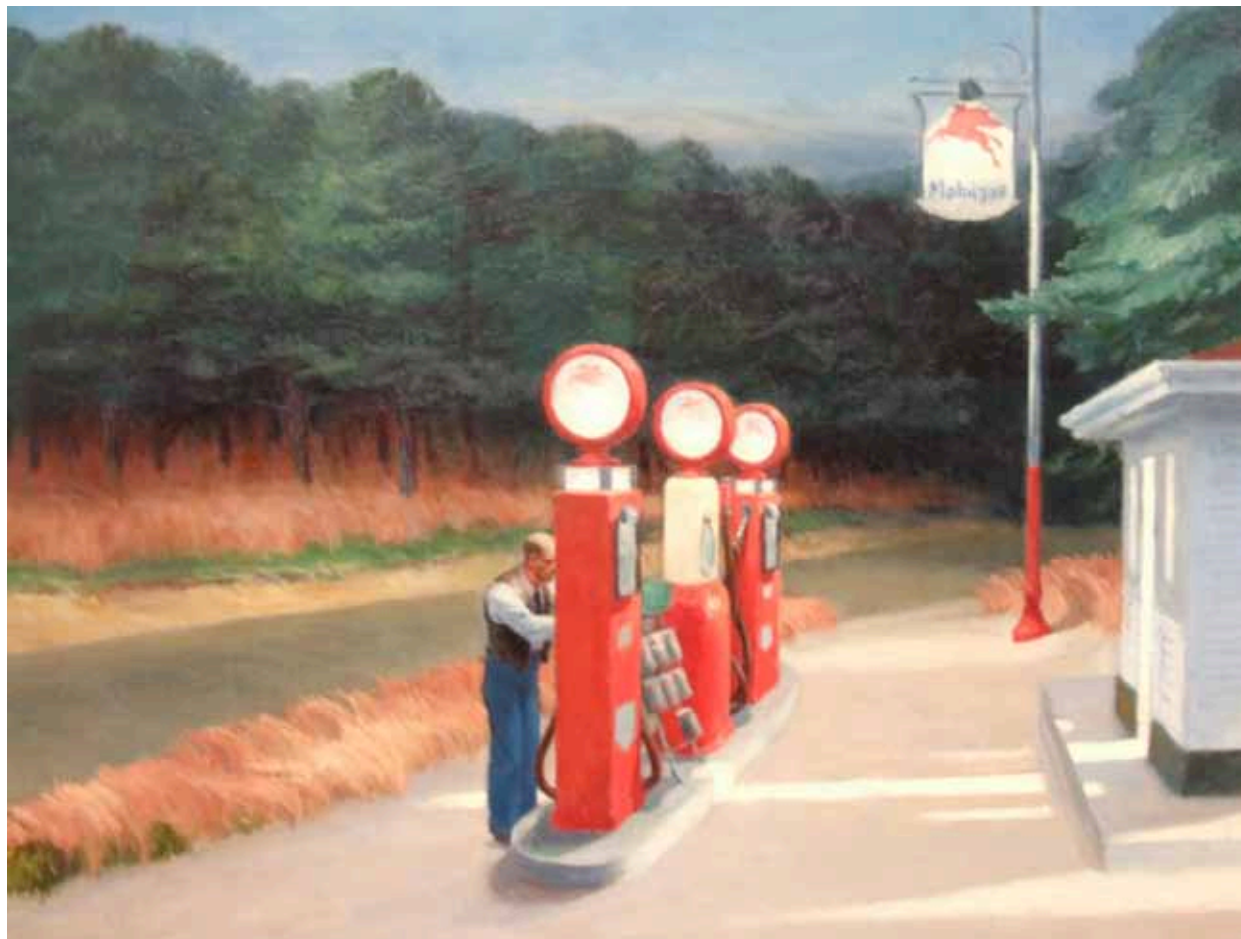
GAS STATION, 1940.