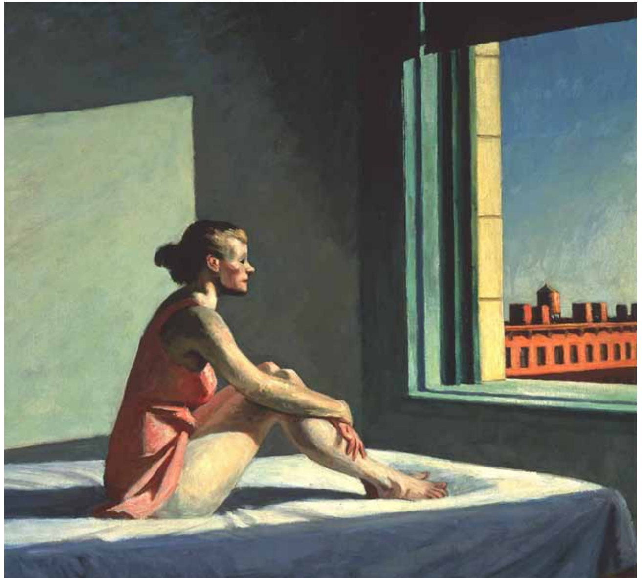
MORNING SUN, 1952.

L'intégralité des films de la collection Hopper vu par... est disponible sur creative.arte.tv