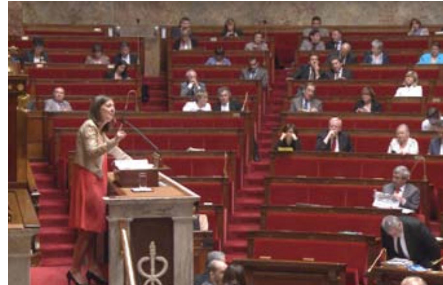
KARINE BERGER (DÉPUTÉE PS) RAPPEUR DU PROJET DE LOI À L'ASSEMBLÉE NATIONALE

« On a assisté progressivement à une caricature du libéralisme. Certains se sont crus tout permis et on leur a tout permis. »