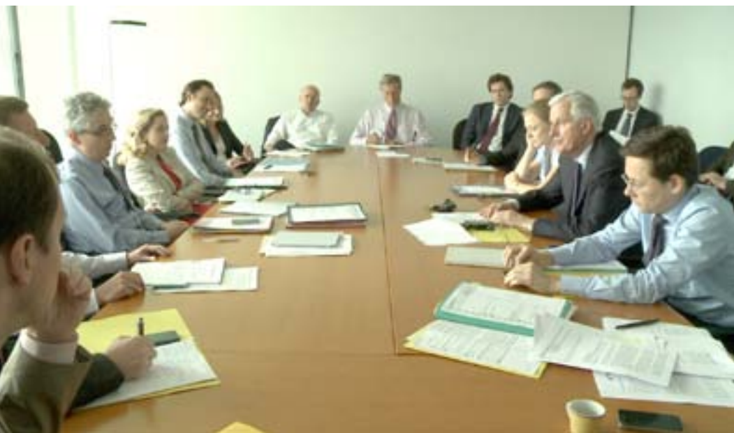
MICHEL BARNIER ET SES COLLABORATEURS