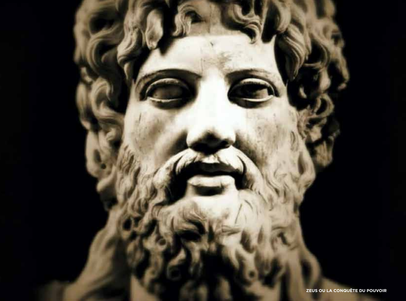
ZEUS OU LA CONQUÊTE DU POUVOIR