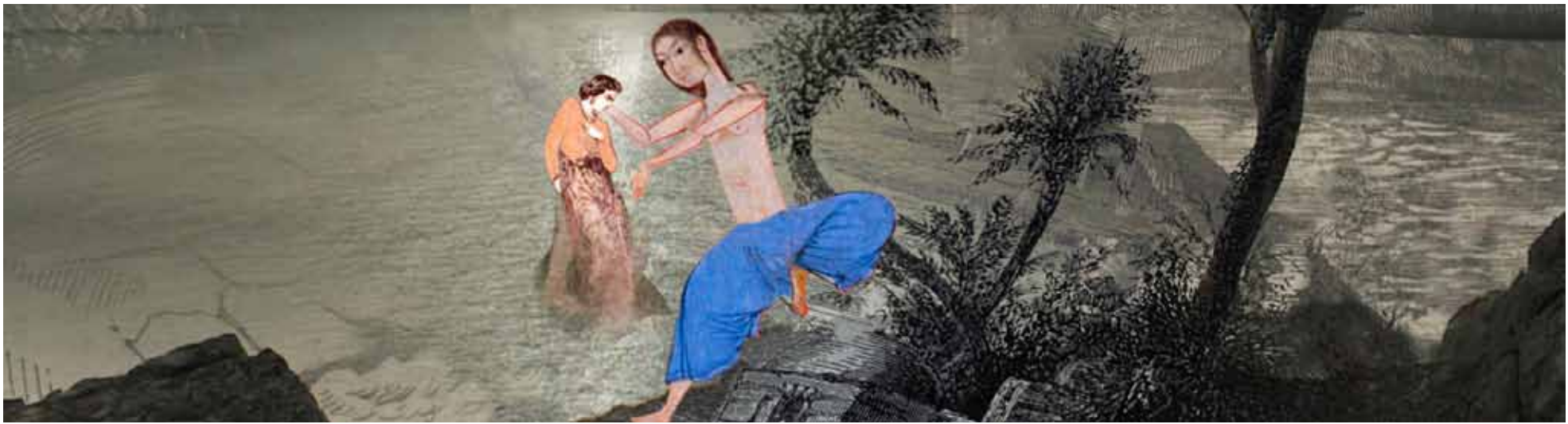
ALADIN ET LA LAMPE MERVEILLEUSE