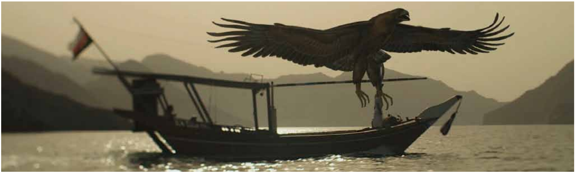
SINDBAD LE MARIN