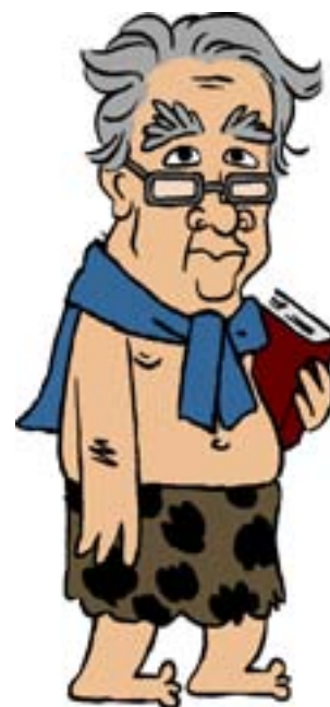
Personnage de Bernard Pivot