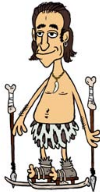
Personnage de Philippe Candeloro

Tout le monde ne s'appelle pas Mazarine Lascaux, mais Web est taraudée par le doute : Blog est-il réellement son père ?