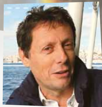
AVEC ANTOINE DE MAXIMY