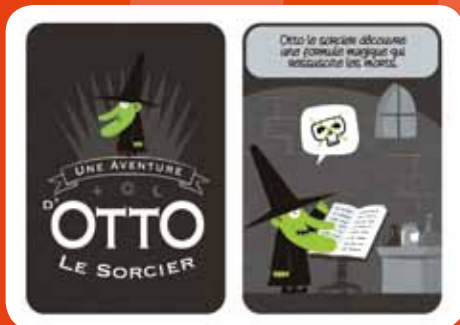
OTTO LE SORCIER PLUTTARK